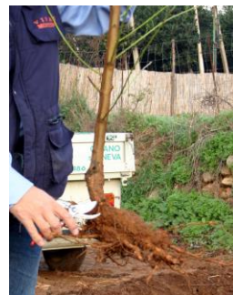
Potate le radici di un terzo