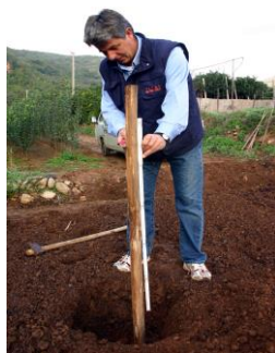
Piantate al centro di essa un palo per il sostegno della pianta, tagliandolo se troppo lungo