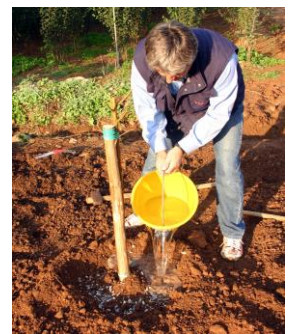
Fate un piccolo solco attorno alla pianta, concimate nuovamente ed irrigate abbondantemente