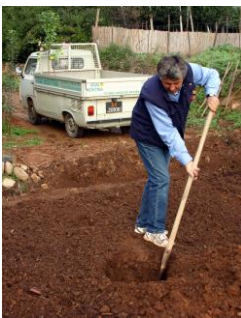
Scavate una buca all'incirca il doppio delle dimensioni dell'apparato radicale

Per le piante a radice nuda, cioè quelle senza pane di terra attorno alle radici, il periodo più indicato inizia nel mese di gennaio per terminare a fine marzo; per quelle già radicate in vaso, invece, è possibile effettuare la piantagione in qualsiasi mese dell'anno.