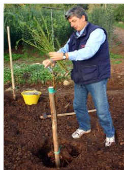
Potate i rami lasciandone solo 4 o 5 all'estremità superiore della pianta