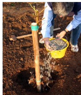
Spargete del concime organico all'interno della buca e ricoprite con la terra