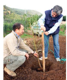
Fissate la pianta al palo posizionando l'innesto verso nord