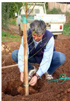
Attenzione a posizionare la pianta in modo che le radici siano sotto del livello del terreno, ma l'innesto sopra